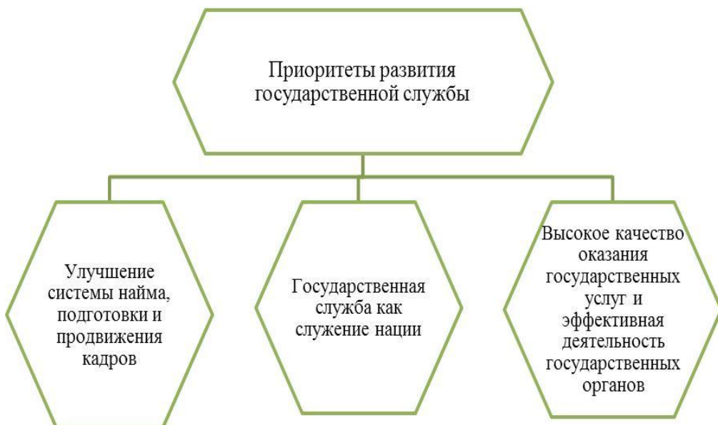
Рисунок 2 – Приоритеты развития государственной службы Республики Казахстан

Концепция новой модели государственной службы, прежде всего, включает модернизацию понятия «государственная служба», которое должно стать синонимом понятия «служение нации (обществу)» и означать ориентацию на население как на потребителя государственных услуг (рисунок 2).