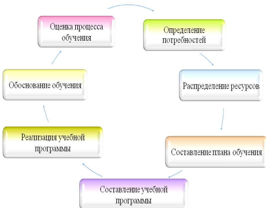
Рисунок 1 – Модель систематического обучения

Достижение целей повышения эффективности системы управления в результате обучения и развития персонала состоит в обеспечении системного подхода в организации обучения, приведенного на рисунке 1.